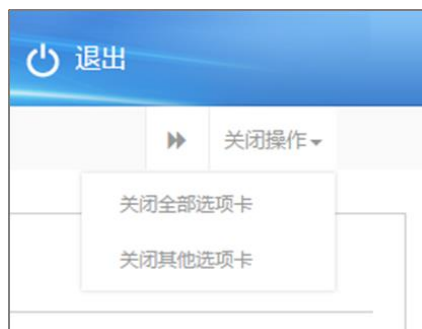
图 关闭选项卡操作