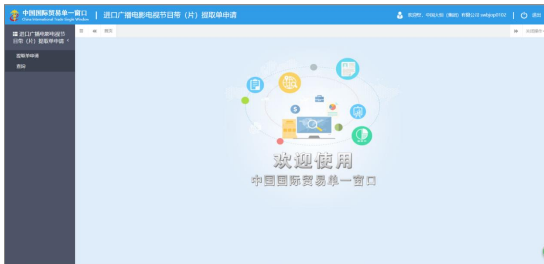
图 进口广播电影电视节目带（片）提取单申请主界面

进入进口广播电影电视节目带（片）提取单申请的界面如下图。点击界面右上角“退出”字样，可安全退出系统。