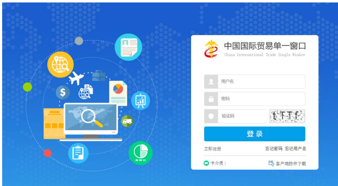
图 “单一窗口”标准版登录

在 图 “单一窗口”标准版登录 中输入已注册成功的用户名、密码与验证码，点击登录。