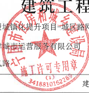
建筑工程项目明细单