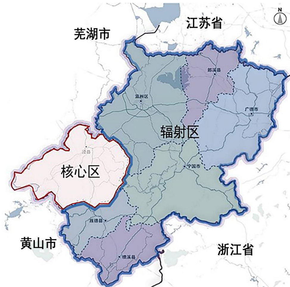
图 1 宣纸文化生态保护区区位图