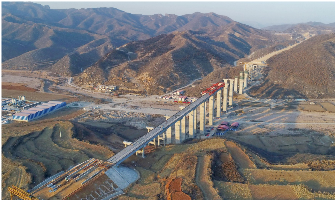
2月7日，在国新办新闻发布会上，交通部部长李小鹏表示，过去5年来贫困地区交通基础设施大幅改善。交通部已明确目标：到2019年底实现具备条件的乡镇和建制村通硬化路，到2020年实现贫困地区国家高速公路主线基本贯通，具备条件的县城通二级及以上的公路。图为太行山高速公路河北段加紧施工。

经了解，杭州市目前共命名了包括小营巷在内的健康社区、健康学校、健康医院等702家健康单位。