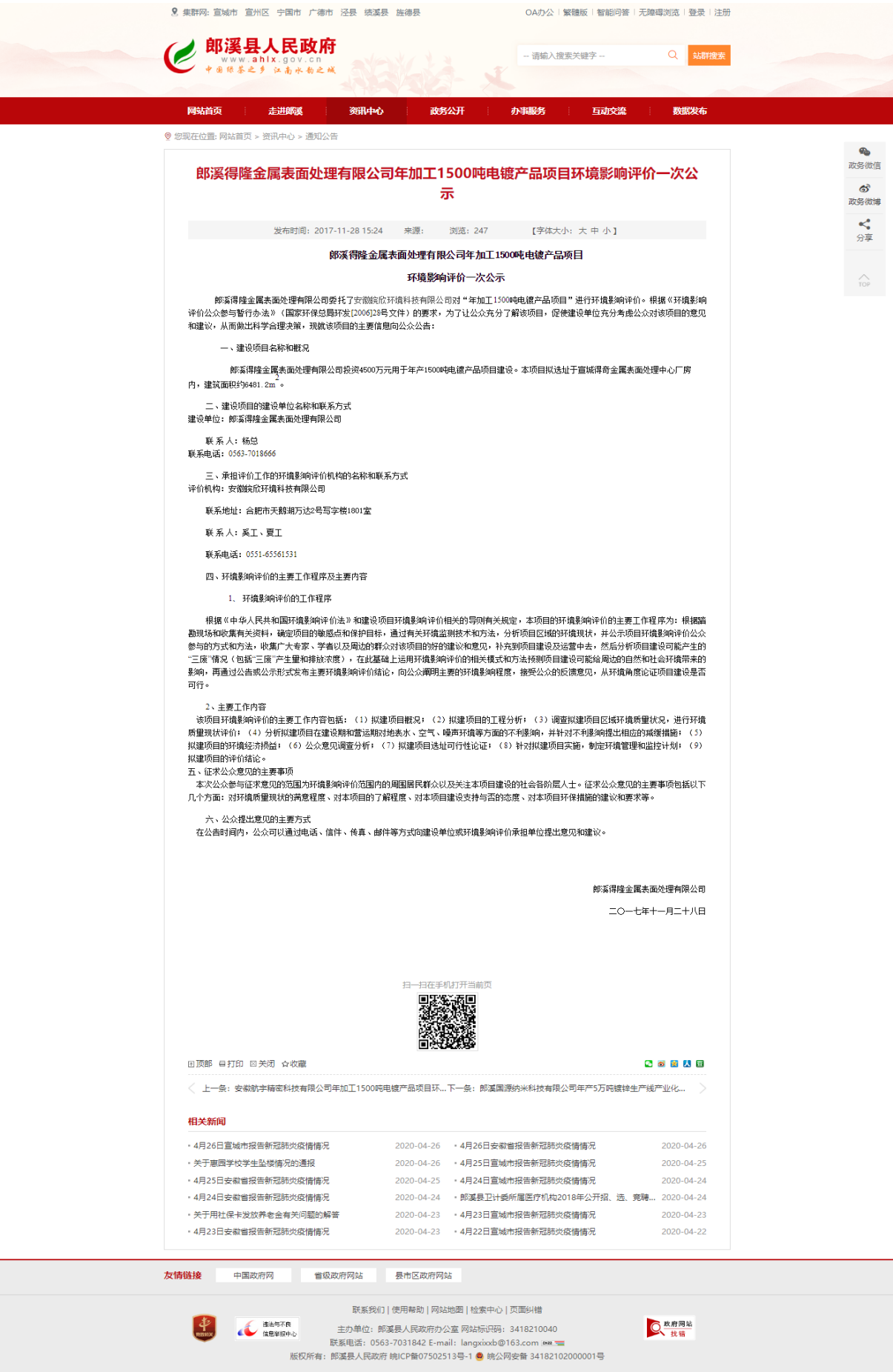
图 1 第一次网络公示截图