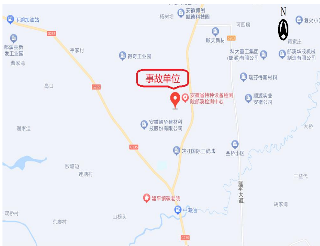
图 1 事故单位地理位置图

际负责人为其父亲宋国华)，注册资本：伍仟万元，住所：安徽省宣城市郎溪县郎溪经济开发区白石涧路 52 号，经营范围：经营范围包括一般项目：工程和技术研究和试验发展；新兴能源技术研发；电子专用材料研发；金属制品研发；新材料技术研发；技术服务、技术开发、技术咨询、技术交流、技术转让、技术推广；金属包装容器及材料制造；高性能纤维及复合材料制造；金属结构制造；防腐材料销售；五金产品零售等。