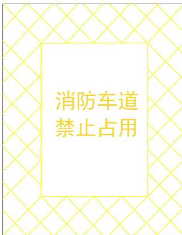
消防车通道禁止占用警示牌示例