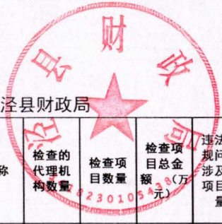
2020年全省政府采购代理机构监督检查基础信息汇总表2