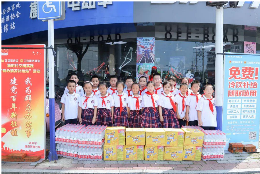
2021年“爱心清凉补给站”捐赠现场

最后特别感谢同学、老师和家长们的爱心奉献，也祝愿孩子们在今后的人生征途中不忘初心，继前路，向光明，永远快乐，健康成长！