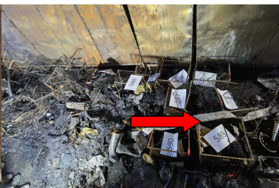
0625 号吊篮南侧烧损情况