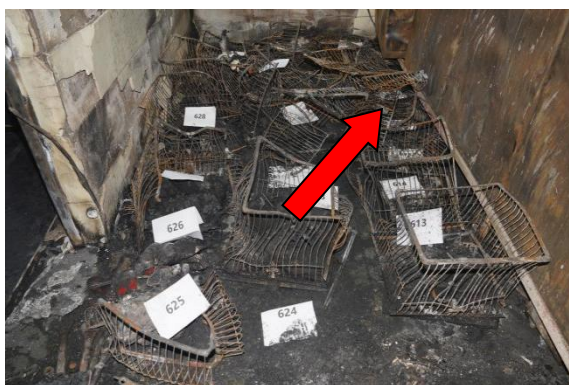
0625 号吊篮附近烧损情况